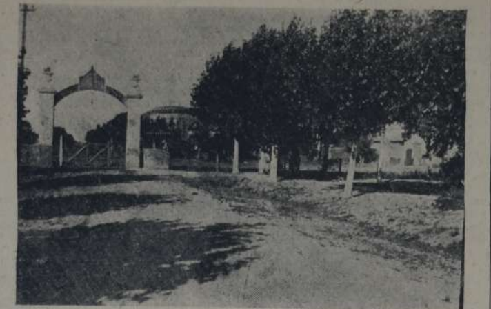
Lugar donde fué herido el demente, pocos metros más adentro de un portón de acceso al hospicio, frente al pueblo, cuyas casas pueden observarse en el fondo.

El doctor Albina nos dice que el hospicio carece de recursos para poder desenvolverse tal como debiera. Apenas